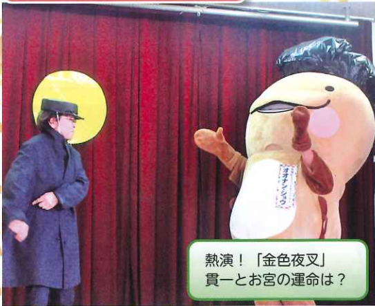
熱演！「金色夜叉」 貴一とお宮の運命は？