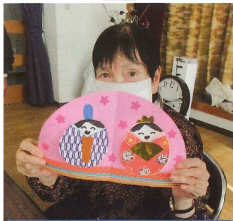
それぞれの力作を集めると、 素敵なひな壇となりました！

西デイサービスセンター正面玄関入ったところに鎮座しています。毎年利用者様の協力のもと、作り上げています。なんとも微笑ましくそしてご利益がありそうです！