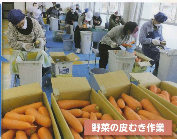
野菜の皮むき作業