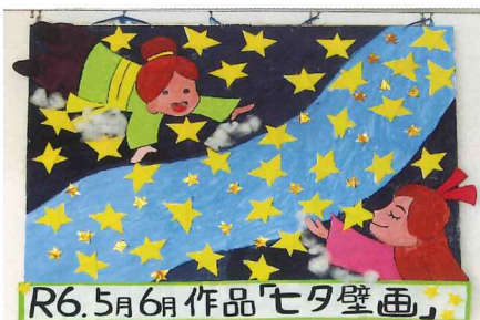
R6.5月6日作品「七夕壁画」

今年も西デイサービスセンターでは彦星と織姫の再開を願って素敵な七夕作品が出来上がりました。